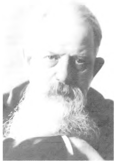
Струве в Белграде. 1930-е годы