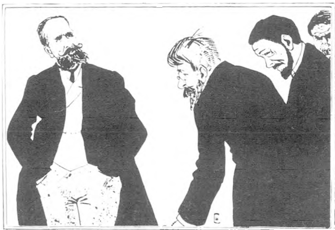
«Осада власти»: карикатура на Струве и Маклакова как пособников Столыпина, опубликованная в газете «Русь» 18 июня 1907 года