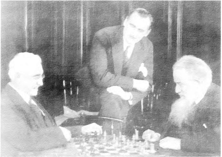
Благотворительная шахматная партия в пользу эмигрантов, организованная в Париже в 1928 году; на заднем плане гроссмейстер А. Алехин