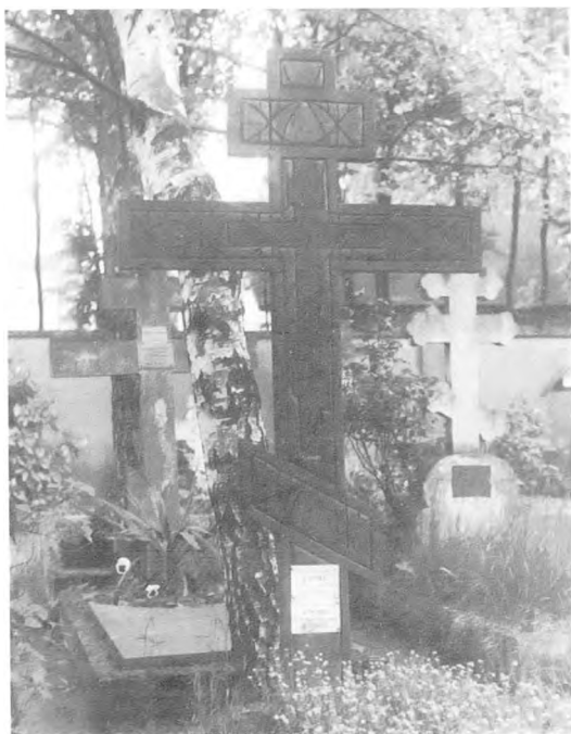
Могилка Струве на кладбище Сент-Женевьев де Буа близ Парижа