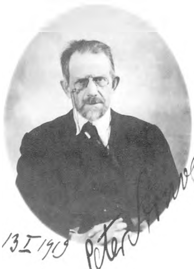
Струве в Стокгольме в январе 1919 года, вскоре после бегства из России