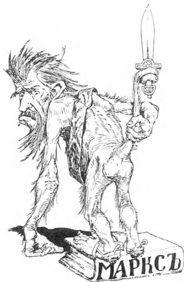
«Национальное величие Струве»: карикатура, опубликованная в радикальном журнале «Рудин» в декабре 1915 года