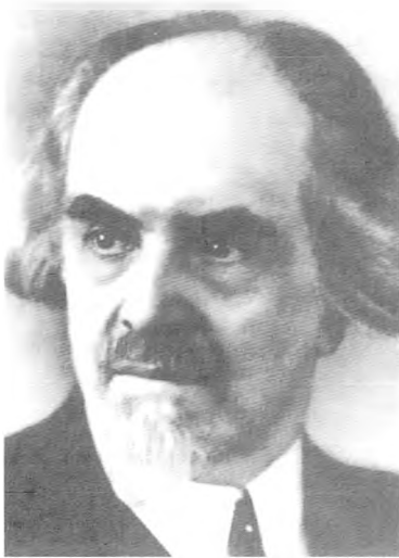
Николай Бердяев. 1934 год