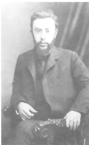
Семён Франк, Мюнхен, 1904 г.