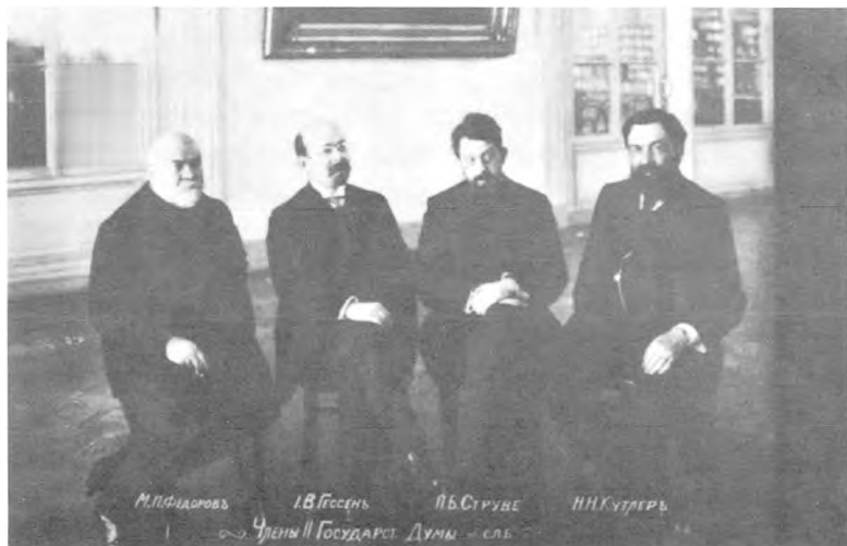
Кадеты, избранные в состав II Государственной Думы от Санкт-Петербурга: М.П. Федоров, И.В. Гессен, П.Б. Струве, Н.Н. Кутлер