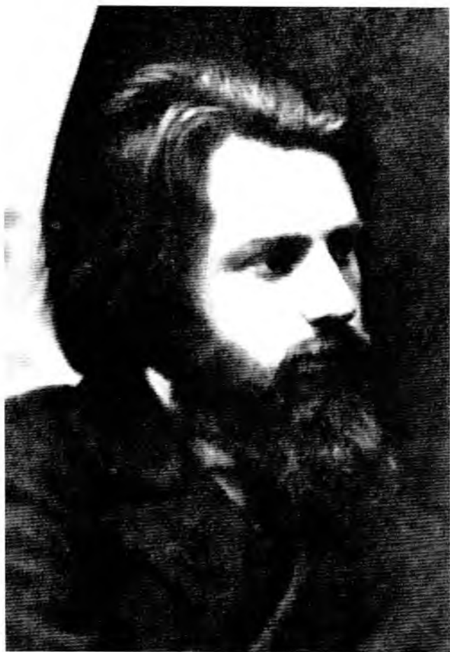
П.Б. Струве — студент, начало 1890-х годов