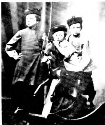
Струве (в центре) с братьями, 1872