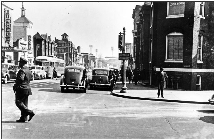
U-стрит в 1930-е гг. На заднем плане видны мачты освещения стадиона Гриффита.