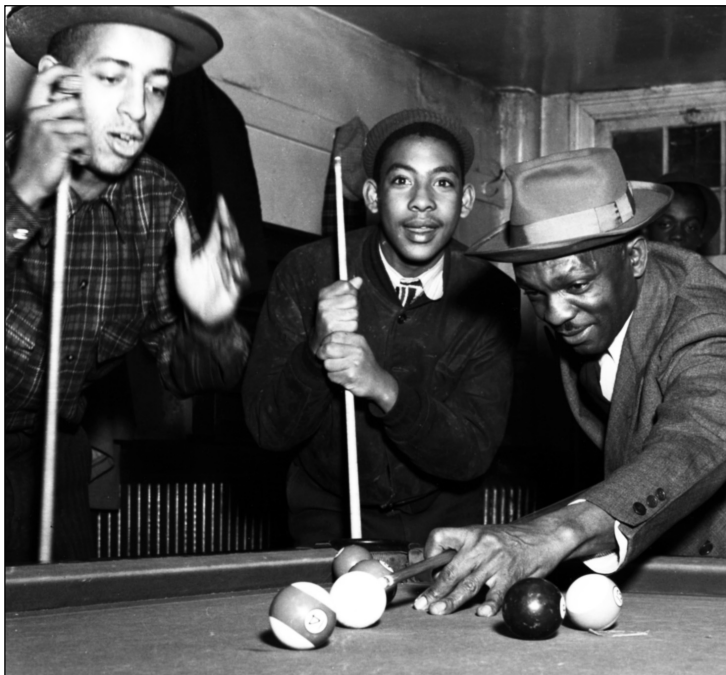
Бильярдный зал "Праздник", 1930-е гг.