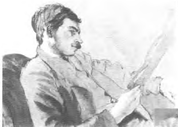
Мейнард Кейнс. Портрет работы Гвена Раверта, 1908 г.