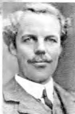
Артур Сесил Пигу