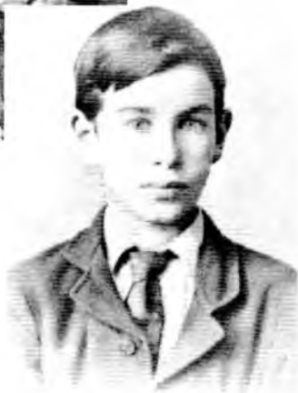
Мейnard Кейнс, Бернард Суинибэнк, Джерард Макурорс Янг