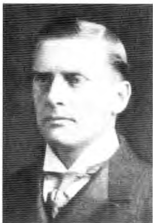
Сэр Оскар Чемберлен