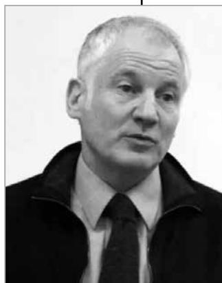
Стивен Коткин, историк