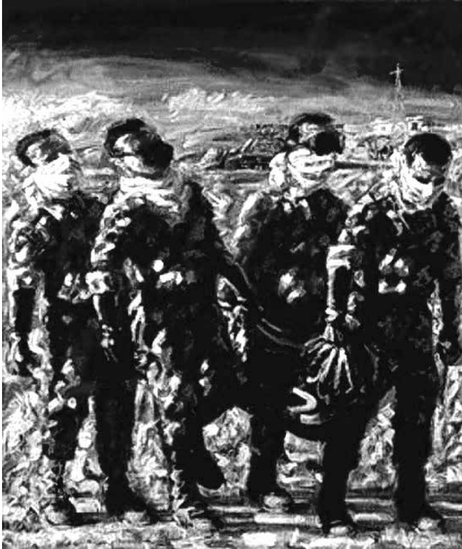
Джон Кин (John Keane). Отряд смерти. 1991

При этом с наказанием за преступление агрессии есть проблема. Преступление агрессии как таковое обозначено в Римском статуте, но Международный уголовный суд по нему не работает. Потому что ни Украина, ни Россия не ратифицировали Римский статут. Выход в данном случае в обращении либо к Международному трибуналу, либо к так называемому «гибридному трибуналу». Последний термин нужно, вероятно, объяснить.