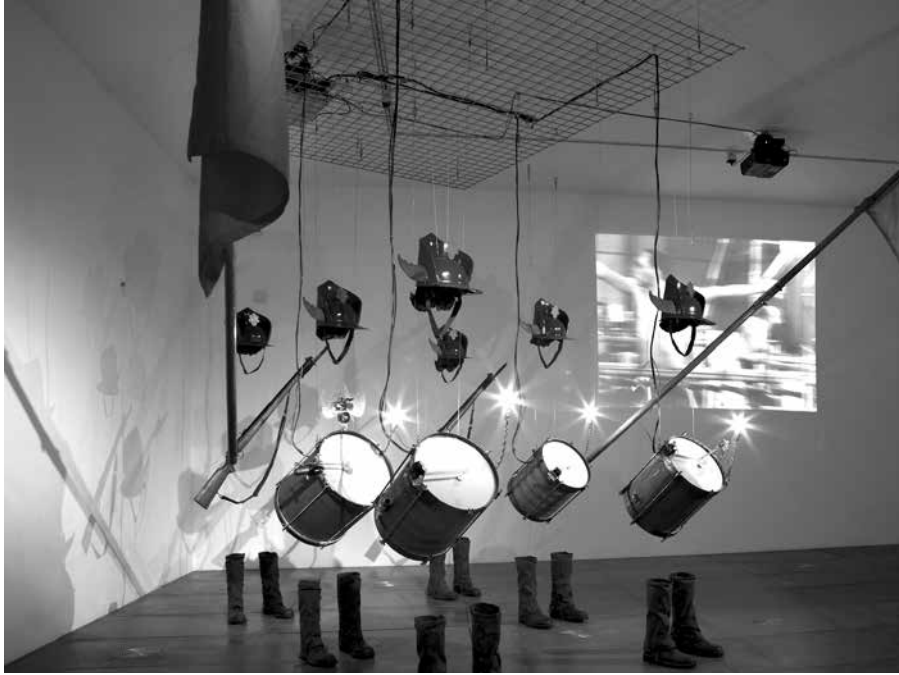
Рой Виллерой (Roy Villevoe). Инсталляция. 2009

или имперскому статусу России». По замечанию вице-премьера Сергея Шахрая, «многие из них сбросили коммунистическое покрывало, но не стали от этого другими людьми». Сохранив привычный образ мышления и действий, они стремились восстановить свой прежний статус, влияние и привилегии.