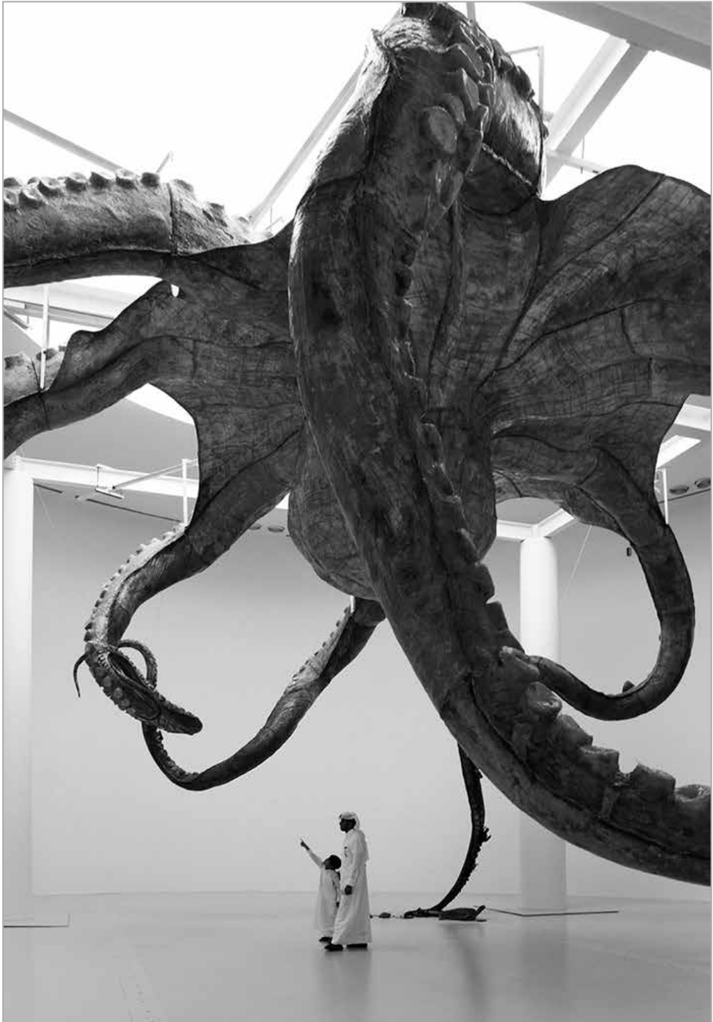
Хуан Юнпин (Huang Yong Ping). Спрут. 2016