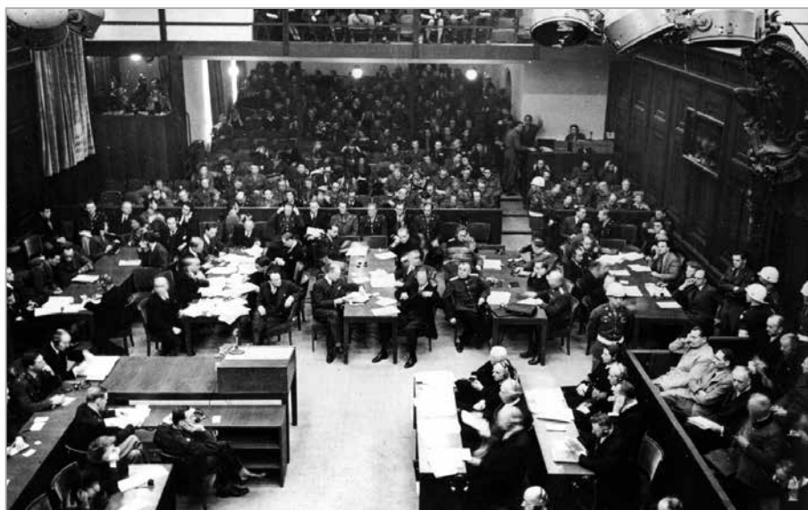
Фотография международного трибунала в Нюрнберге. (20.11.1945 – 01.10.1946)

по образцу Московских процессов 1936–1938 годов — как большой политический спектакль с предрешенным исходом. Нюрнберг должен был высветить всю глубину злодейства нацистов и вынести обвиняемым смертный приговор.