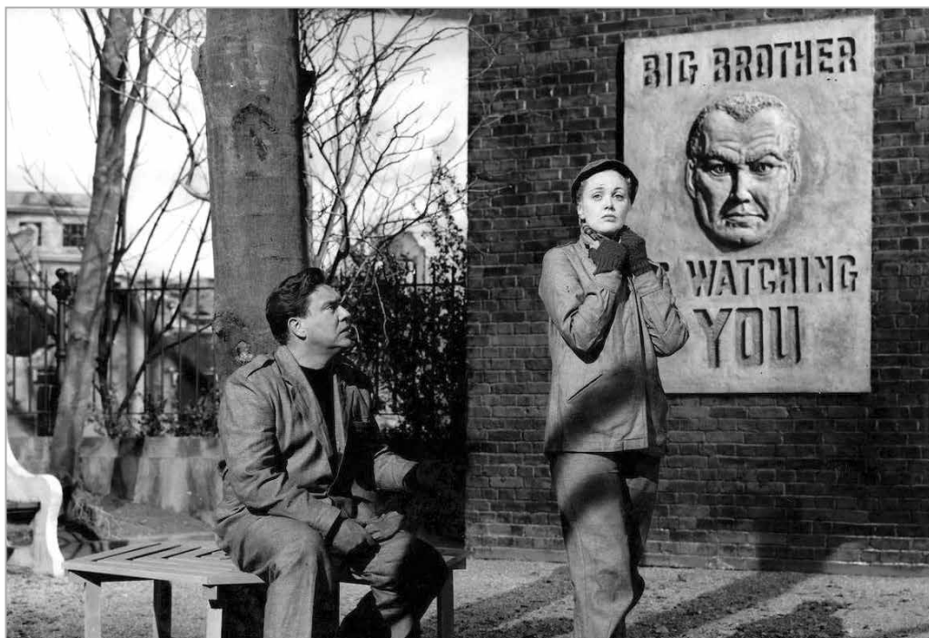
Кадр из фильма «1984», режиссер Майкл Андерсон. 1956

этот рост остался на бумаге? Вовсе нет. Рост влияния «органов» при Андропове на советскую повседневность выглядел очевидным.