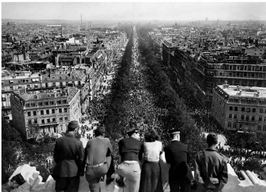
Американские военные в день окончания войны. 8 мая 1945 года

и служил советскому правительству 13 . Лемкин и Лаутерпахт — представители либеральной правовой традиции. Они вписываются в сюжет. Трайнин сделал карьеру в сталинском СССР, и его прежние работы подвели основу под советские показательные процессы. Поэтому он определенно не вписывается 14 .