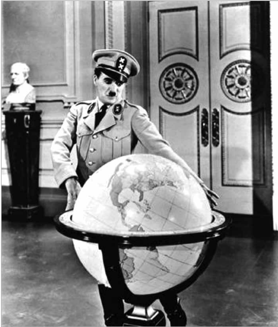
Чарли Чаплин. Кадр из фильма «Великий диктатор». 1940

воспроизведении в свободном обществе, где он более не опирается на репрессивную власть. Тут он издыхает как рыба, выброшенная на берег. Примером может служить эпизод, имевший место в начале марта 2023 года, когда во время встречи «Большой двадцатки» в Индии министр иностранных дел России Сергей Лавров тщился утверждать, что войну начала Украина, а не Россия. Вместо того чтобы пытаться оспорить столь бессовестное искажение реальности, собравшиеся дипломаты ответили Лаврову дружным смехом.