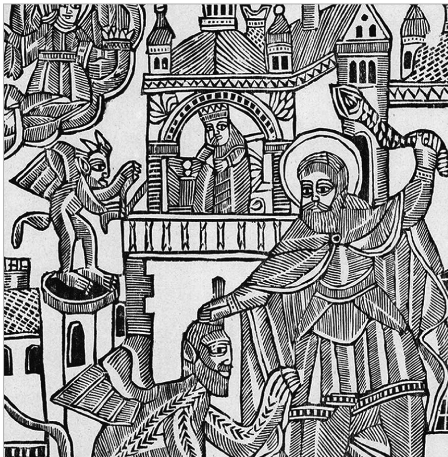
Народный лубок, аллегорически изображающий наступление московского православия в виде чёрта. Литва, XVIII век

Религия и православная церковь сыграли ключевую роль в выживании государств — правопреемников Киевской Руси. Православие служило объединяющей силой даже при татарском правлении, формируя социальную ткань княжеств. Возникла Литовская Русь, основу которой составляло православие, а административным языком был русинский на основе церковнославянского.