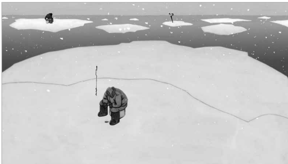
Владимир Леицёв. Кадр из мультфильма «Пропавшие в снегах». 2007