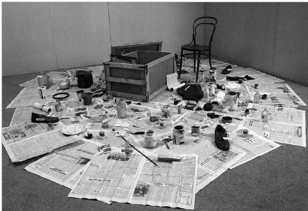
Илья Кабаков. Ящик с мусором. 1981

яростно критикует своего предшественника. Даже в газетах тогда об этом писали с иронией: мол, молодой человек, не надо заниматься излишним самобичеванием, не стоит перегибать. Но замысел сработал и себя оправдал. Карьера пошла в гору: комсомольские посты, переход в [имевшую в 1940–1956 годах статус союзной] Карело-Финскую республику, затем там же и партийная работа.