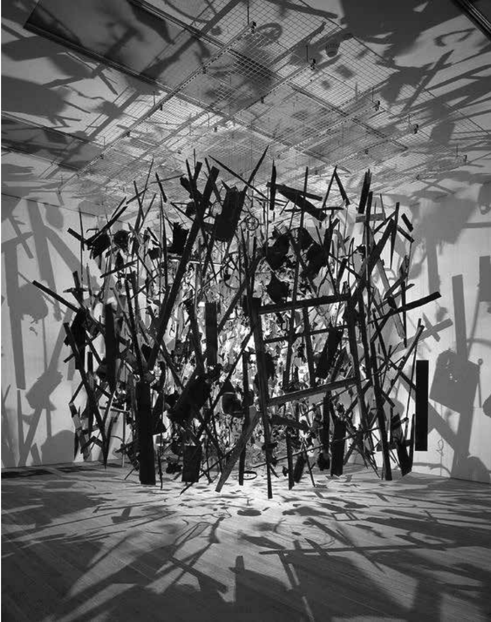
Корнелия Паркер (Cornelia Parker). Холодная темная материя: наблюдение за разрушением. 1991

трудный, но успешный путь — ей удалось сохранить гордость великой страны, но также пришлось принять менее значительную роль в международном устройстве. И в результате удалось добиться процветания и мира для французского народа и его соседей.