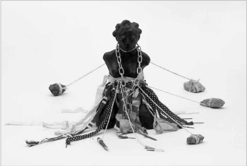
Розана Паулино (Rosana Paulino). Шитье памяти. 2006

Отечественной войне нельзя представить без участия коммунистов. У меня в связи с этим такой вопрос: возможно ли полностью отречься от советского наследия без изменения, без искажения исторических событий, которые все-таки имели место? И как в условиях информационной войны бороться с этим и изучать историю?