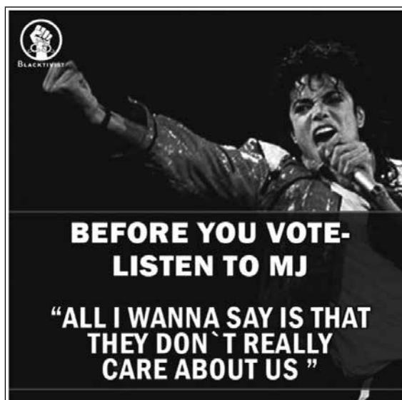
Мем, распространявшийся Кремлем перед президентскими выборами в США 2016 года 50

являются естественной целью пропагандистов. По словам предпринимателя и специалиста по коммуникациям Джеффа Гизи, «троллинг — это, можно сказать, эквивалент партизанской войны в социальных медиа, а мемы — валюта пропаганды».