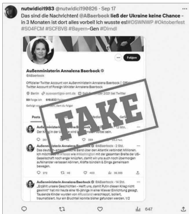
Фальшивый твит министра иностранных дел Германии Аннелены Бербок 68

Этот метод, также называемый «двойники» или «клоны», уже был описан в главе 4. Часто в нем используются измененные скриншоты. Например, в копию страницы сайта Spiegel Online был вставлен поддельный твит министра иностранных дел Бербок с заявлением, что война в Украине закончится через три недели, чего она никогда не говорила. В этом случае российское происхождение подделки выдала одна деталь: в счетчике пользователей видна русская, а не немецкая аббревиатура.